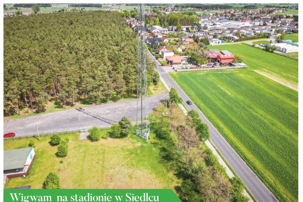
Wigwam na stadionie w Siedlcu