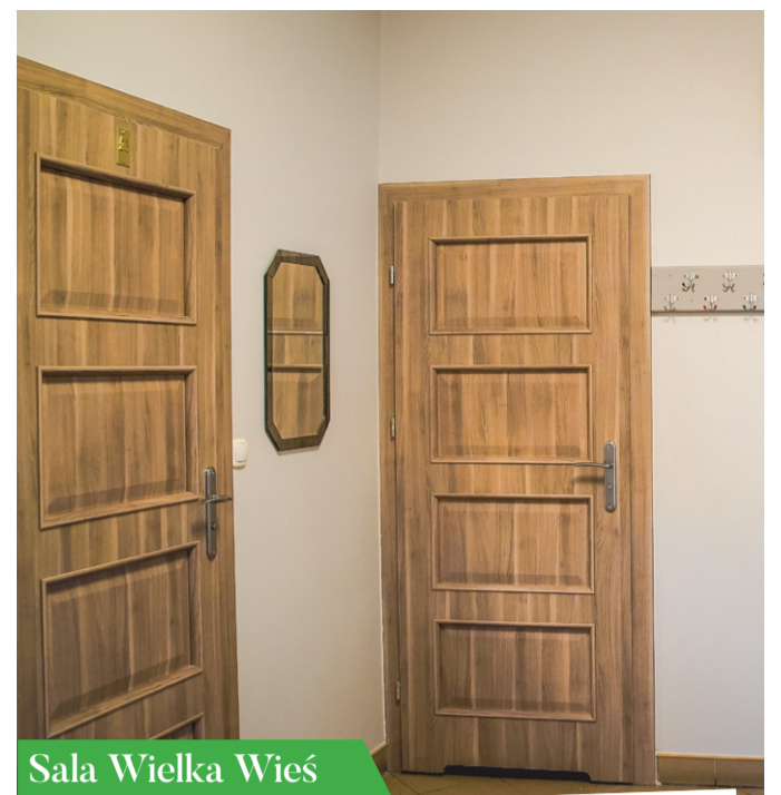
Sala Wielka Wieś