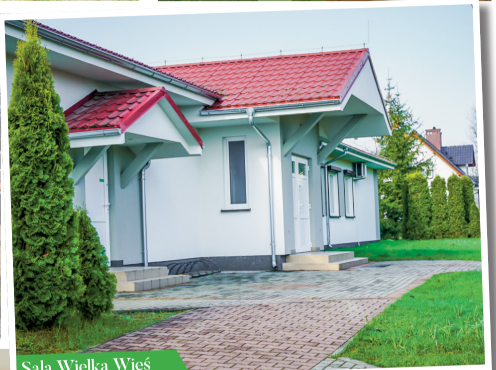
Sala Wielka Wieś