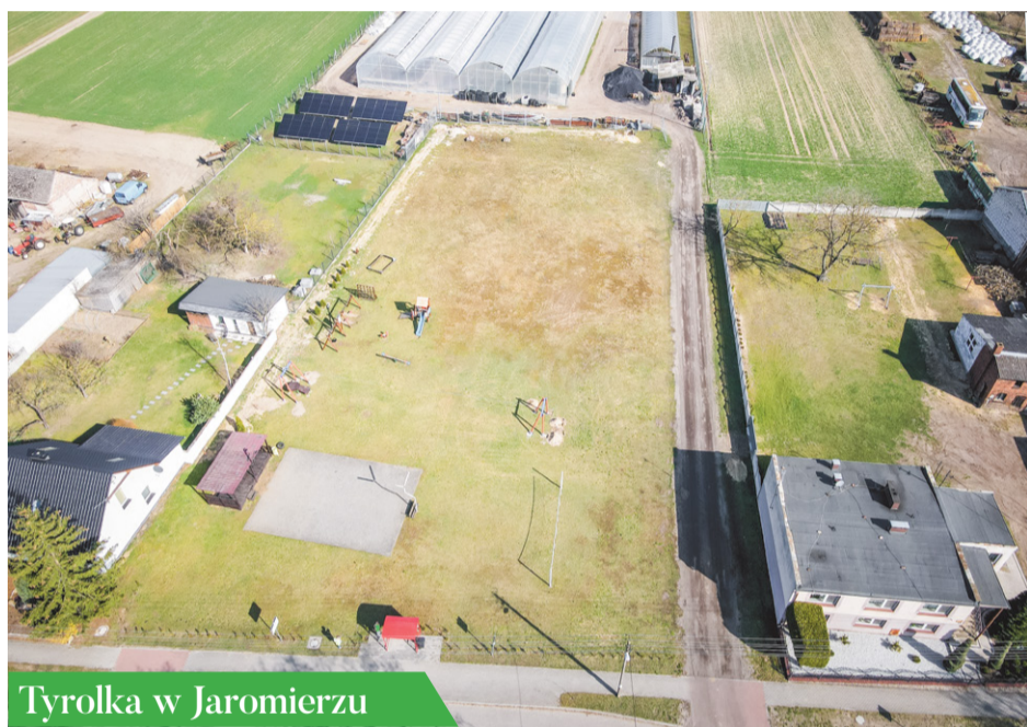
Tyrolka w Jaromierzu