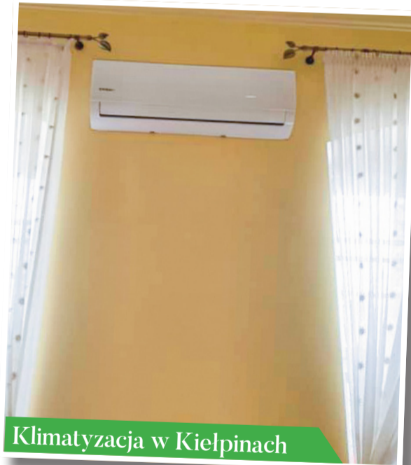
Klimatyzacja w Kielpinach