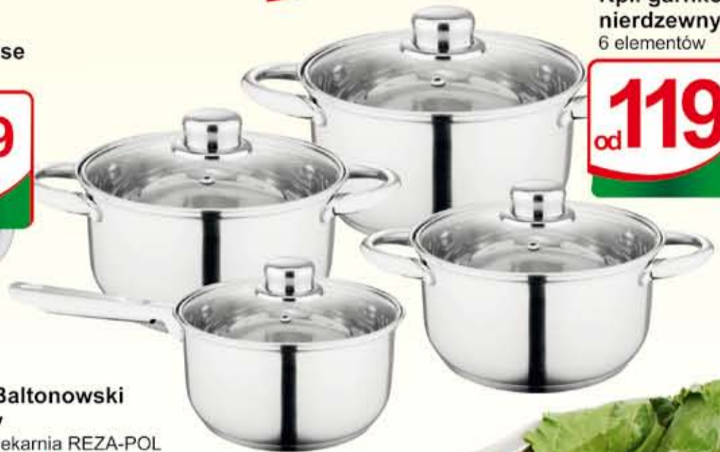
Kpl. garnków nierdzewnych 6 elementów