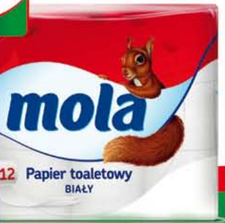
12 Papier toaletowy BIAŁY