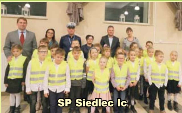
SP Siedlec Ic