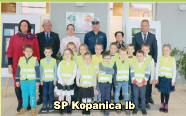
SP Kopanica Ib