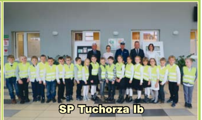
SP Tuchorza Ib