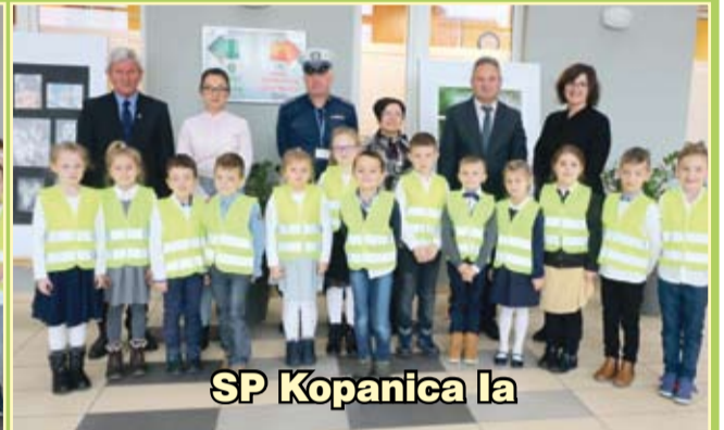
SP Kopanica Ia