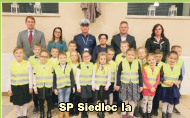
SP Siedlec Ia