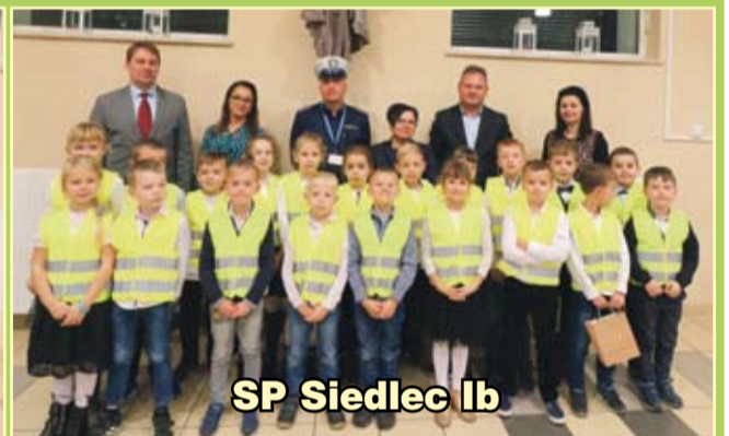
SP Siedlec Ib