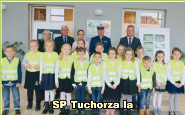
SP Tuchorza Ia