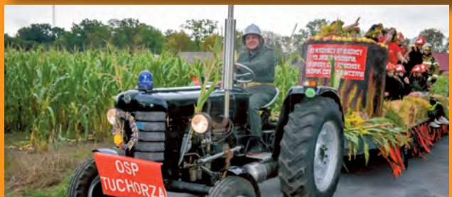
Stare maszyny rolnicze budziły duże zainteresowanie mieszkańców podczas dożynek.