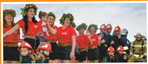
Drużyny z Ochotniczej Straży Pożarnej z Tuchorzy były gwiazdami jednej z platform.