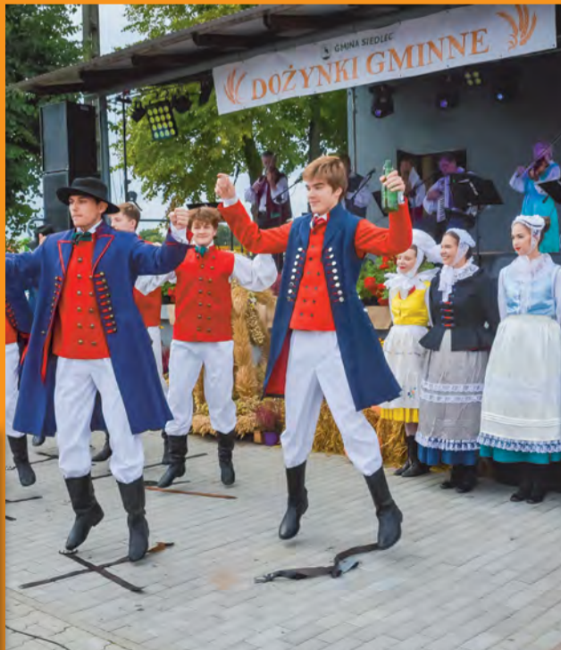
Obrzęd dożynkowy zaprezentowali tancerze z Zespołu Tańca Ludowego Cybinka-Grodzisk.